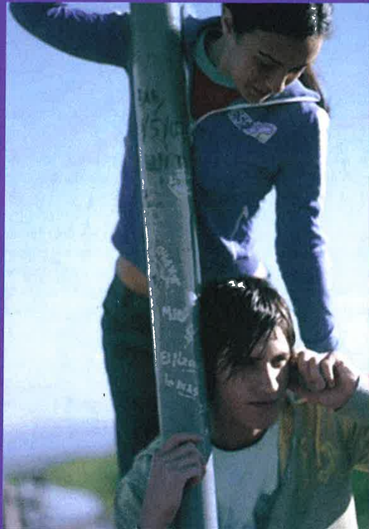
Mynd frá Google