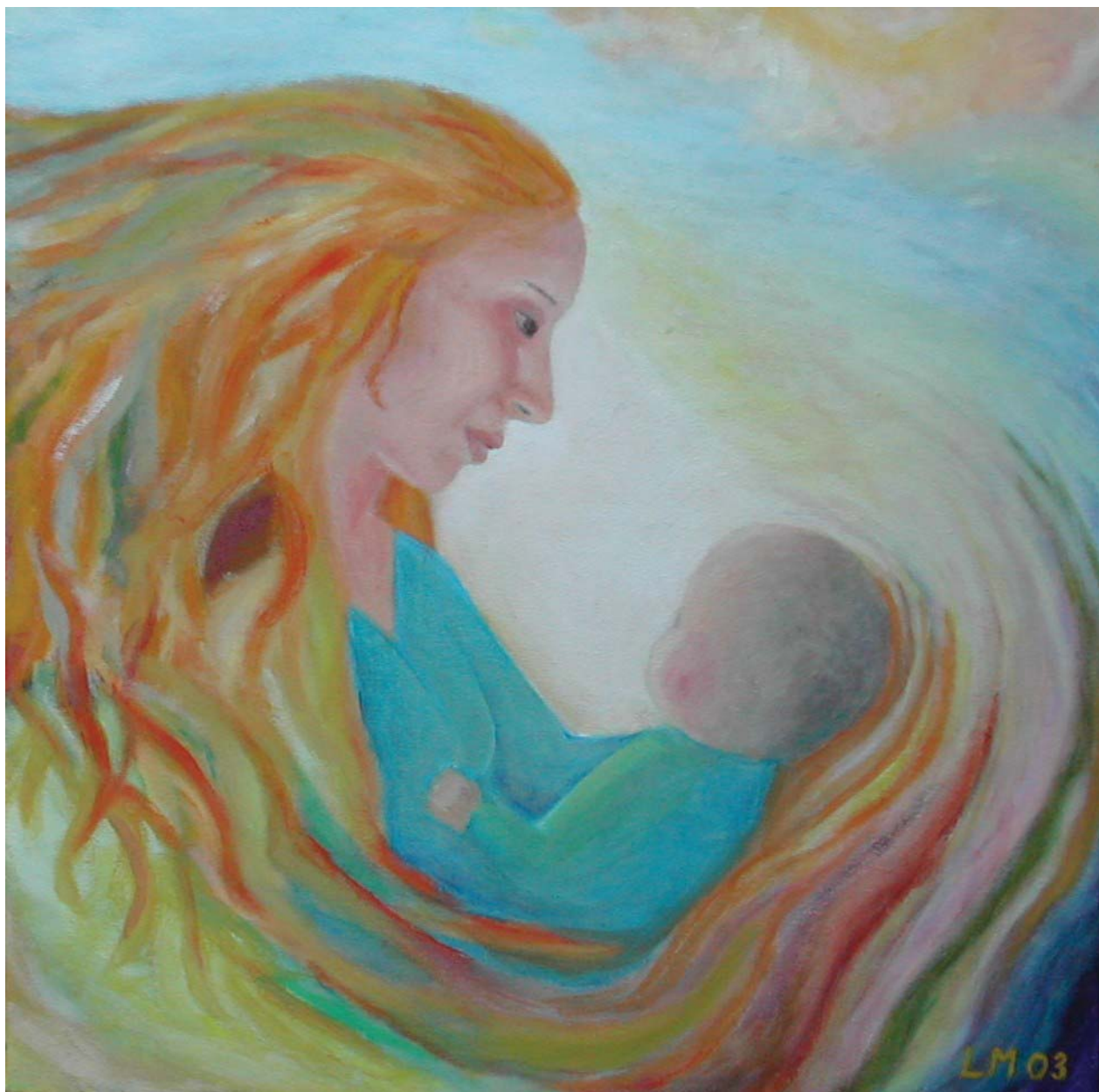
Mynd frá alnetinum