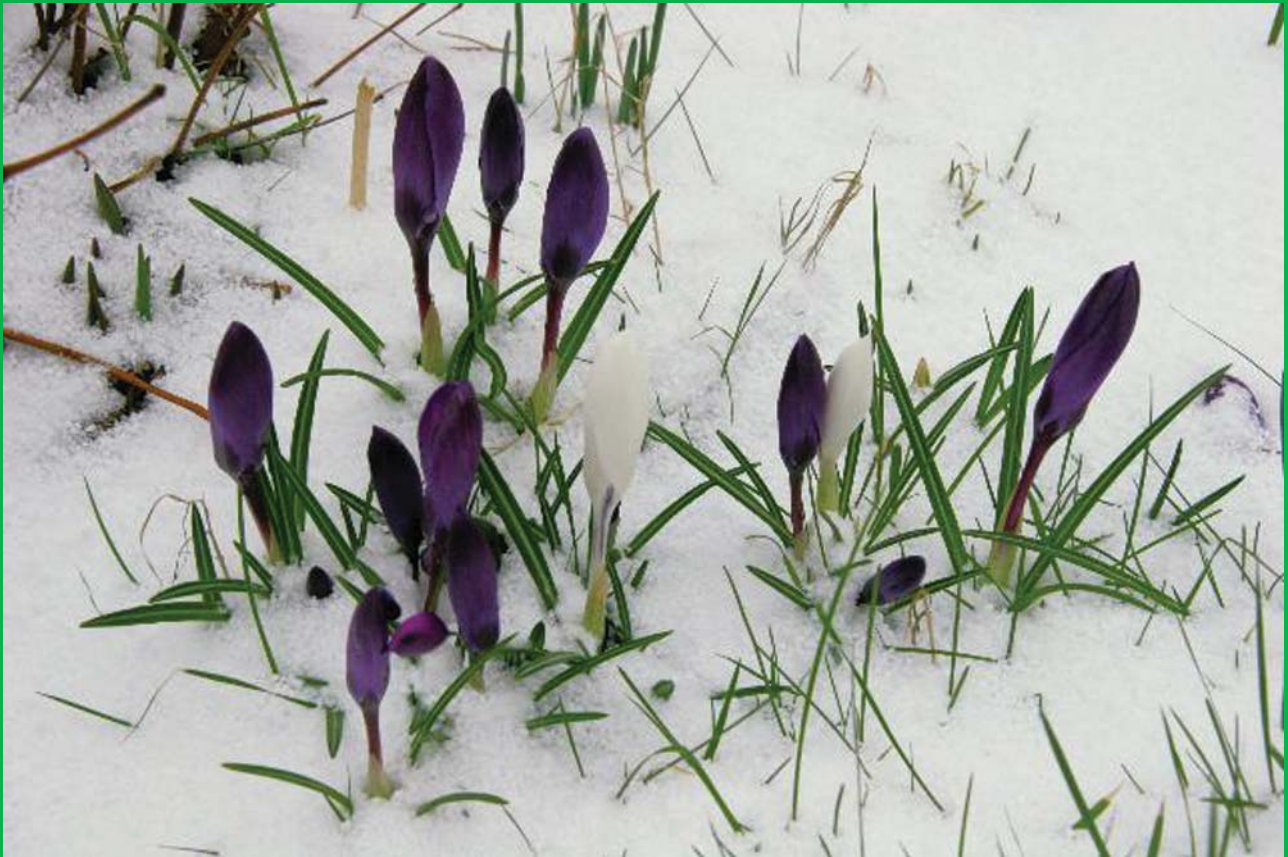
Krokus í kava.