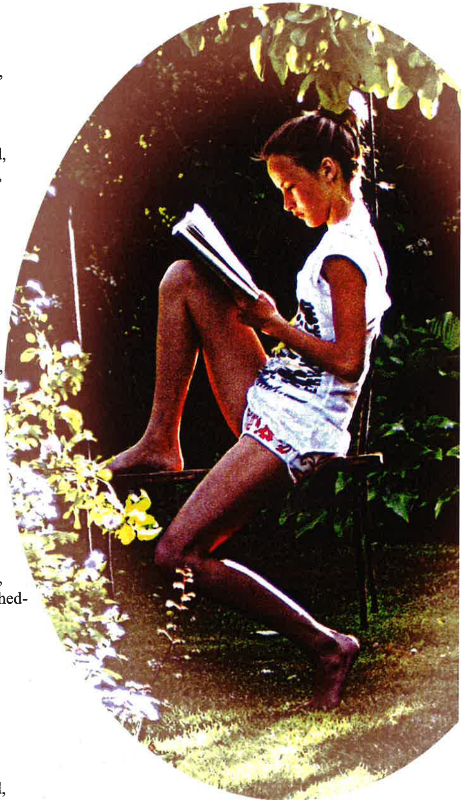
Mynd 1: Vejen til din drømmehave - s. 117 Mynd 2: Vejen til din drømmehave - s. 150

Jeg elsker at lege alene, og tegne og modellere, men har jeg leget længe nok alene, så vil jeg ikke lege alene mere, så er det godt at ha' en rigtig ven, og ha' nogen at lege med igen. en man kan hoppe eller gyngede med, en man kan grine eller synge med. det er rart at være alene - men det er bedst at ha' en VEN!