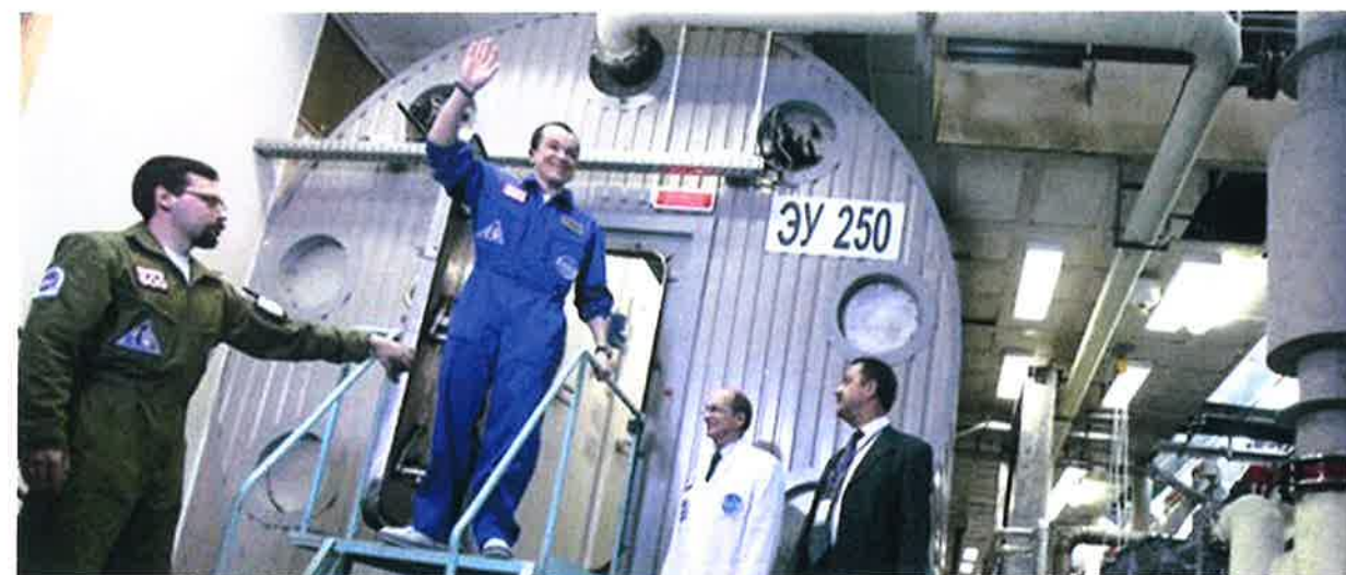
dr.dk.nov. 2011 21.36 Udland