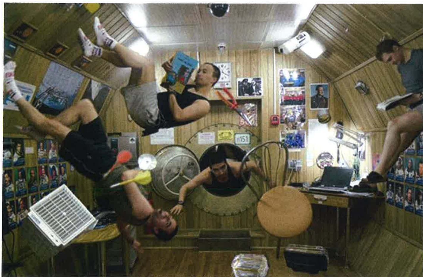
dr.dk.nov. 2011 21.36 Udland

I dagbogen skal du bl.a. komme ind på, hvordan I fik tiden til at gå, og hvordan I arbejdede sammen.