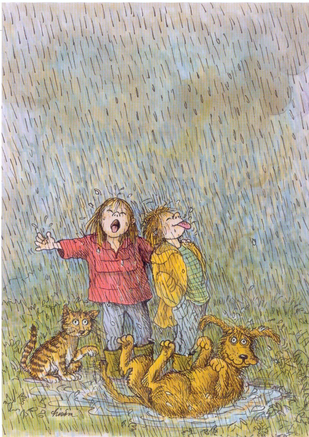
Worsaaesvej 9 • 1972 Frederiksberg C