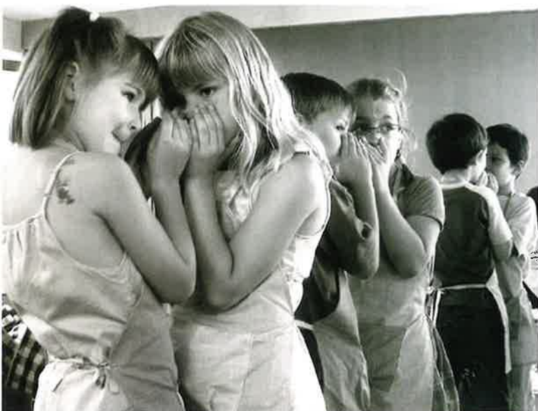
Mynd frá alnótini

Jo flere dærlige hemmeligheder, der er i en familie, jo sværere er det at være i den.