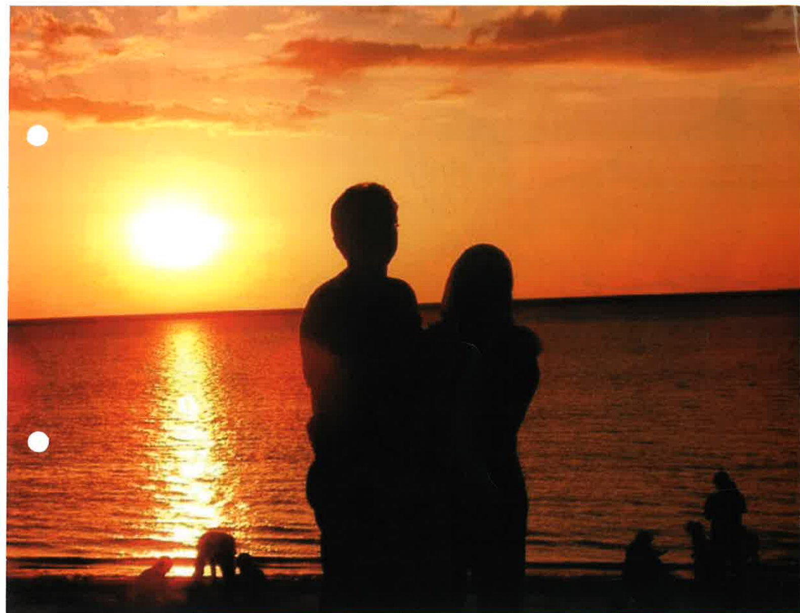
Mynd frá alnótini