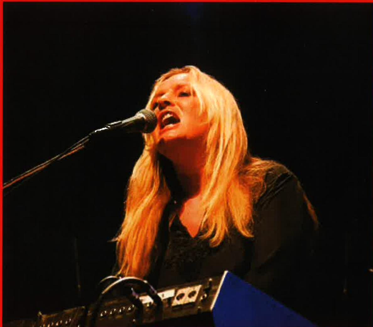
Mynd frá alnótini