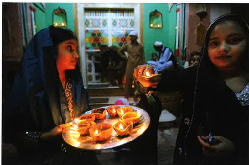
Børn hava tendrað ljós í sambandi við divali.

Divali er eisini nýggjárið har norðuri í India. Tað verður hildið við at vaska sær í vælangandi olju, fara í nýggj klæði, geva gávur og eta góðan mat.