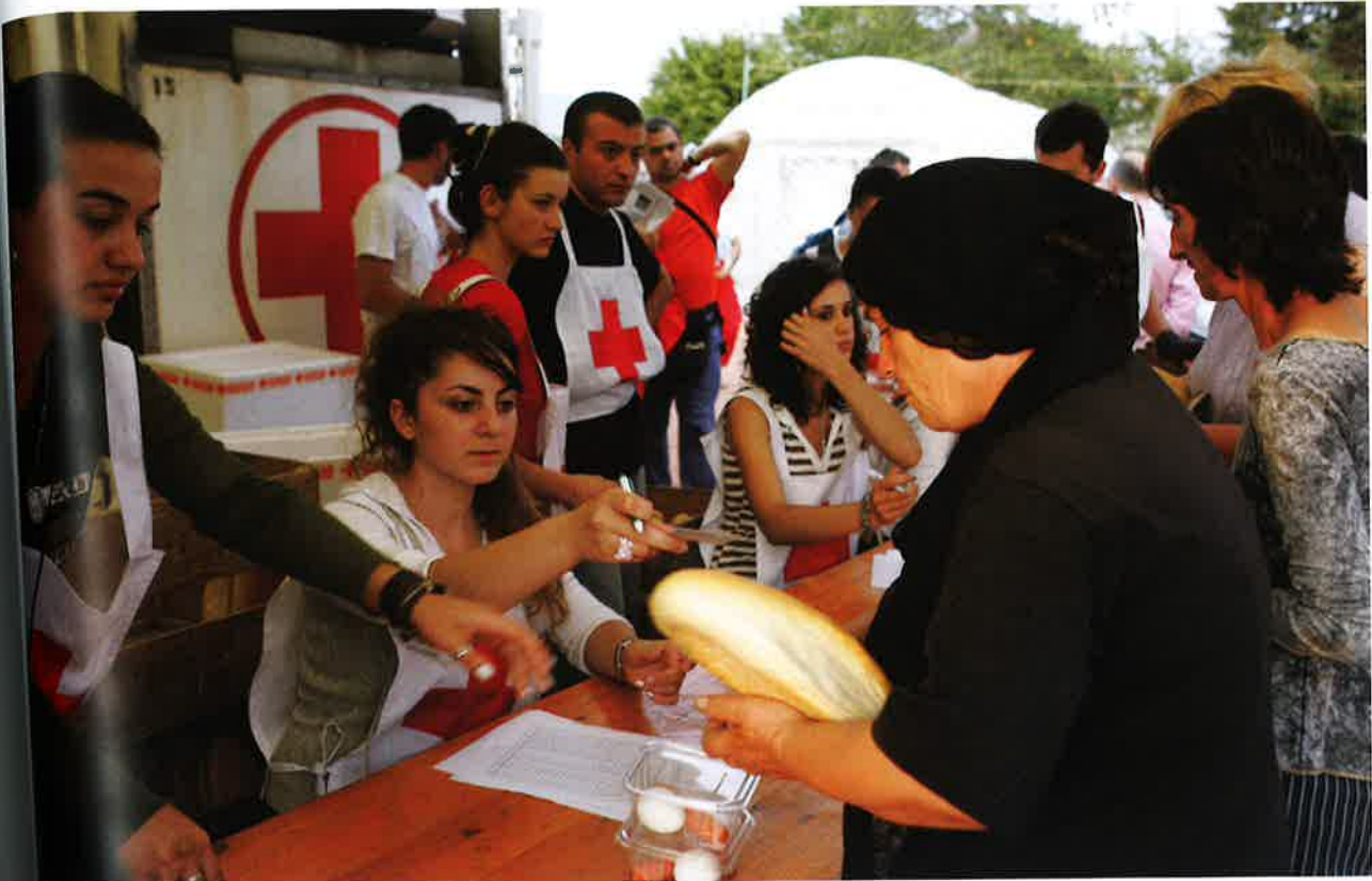
Reyði Krossur gevur fólki mat í eini flóttafólkalegu í Georgia.

ment viðurkend, og bæði eru nú vard undir Genèvesáttmálanum. Í 1864 var almenna navnið á alheimsfelagsskapinum broytt: Altjóða Reyði Krossur og altjóða Reyði Hálmáni.