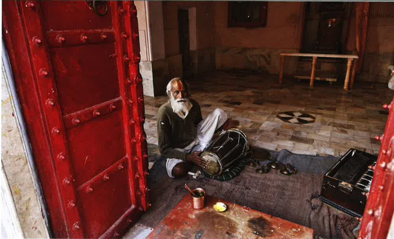
Hindumunkur slær á trummu í einum templi.

vísa gudinum virðing. Hann steðgar átta ferðir, eina ferð fyrir hvörja hövuðsætt, suður, norður, eystur og vestur, og eina ferð fyrir tær ættir, ið eru millum hövuðsættirnar. Síðan nemur tann vitjandi við vegginn antin við hondunum ella við pannuni.