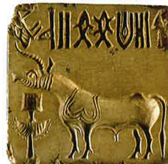
Segl við innskrift og myndum.

Heimsátrúnað nevna vit ein átrúnað, sum hevur nógv viðhaldsfólk, og sum er spjaddur um stóran part av heiminum.