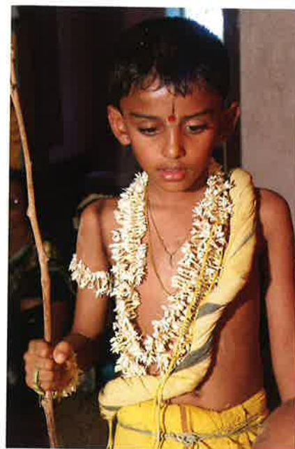
Í sambandi við upanayanaritual ið fær drongurinn ofta ein stav, eitt belti og ein heilagan tráð.