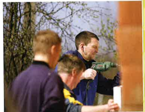
Stúdentar á Tekniska skúla í Havn í Rumenia at rætta eina hjálpanði hond.

Til eru ferðamannaskip, sum eru umbygd til flótandi sjúkrahús.