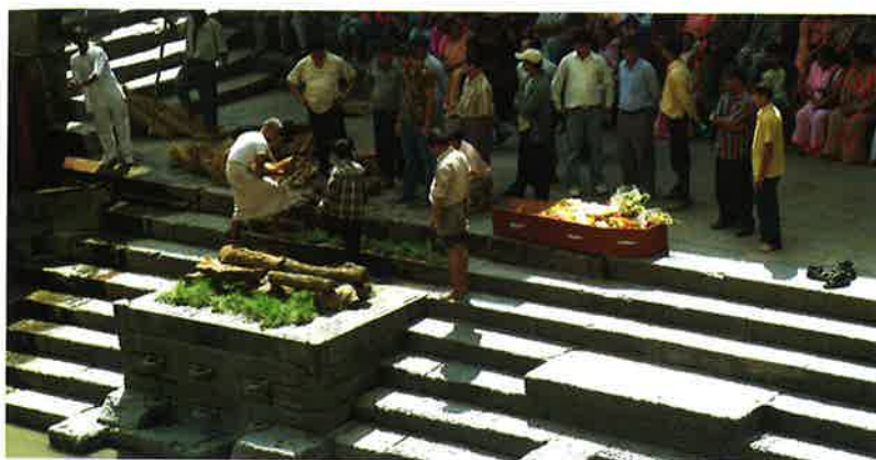
Hinduar gera klárt at brenna lík.

Endin á samsara er moksha. Allir hinduar vóna at náa hagar og ongantíð at fœðast aftur, men verða sameindir við brahman, sálina í øllum livandi, har alt byrjaði.