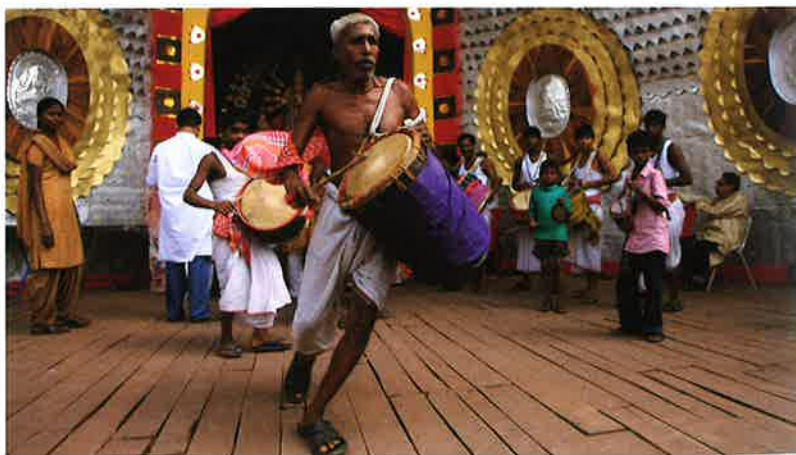
Veitsla og dansur í sambandi við navaratra.

Navaratra, tær tíggju næturnar, er til minnis um, at móðurgudinnan, Durga, vann á búfflademoninum, Mathisa. Mýtan sigur, at Mathisa hevði tikið valdið á himni og á jørð. Hann helt, at hann kundi tíggja sær, sum hann vildi, tí Brahman, skaparin, hevði lovað honum, at bara ein kvinna kundi gera av við hann, og tað helt Mathisa ikki vera serliga sannlíkt. Í hesi mýtu verður Durga skapað av glæmuni frá mannligu gudunum. Teir høvdu sjálvir ikki megi at vinna á Mathisa. Durga fær eitt vápn frá hvørjum gudi, og tá Mathisa skapar seg um til ein búffil og loypur á Durga, verður hon ikki særd. Mathisa skapar seg um aftur til ein demon, men tá rennur Durga eitt svørð í hann, so hann doyr. Tað góða vann á tí ónda. Hesar tíggju næturnar brennur eitt ljós á altarinum heima, fólk halda gudstænastu hvørja nátt, tey ofra, halda veitslu og dansa.