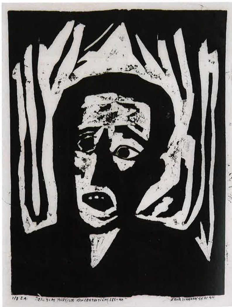
Ein, sum yvirlivdi týningarleguna, 1994, eftir Øssur Johannesen, f. 1970

Enn eru lond, ið hava deyðarevsing. Eisini tey roynir Amnesty at ávirka.