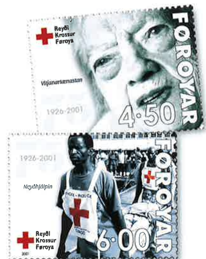
Tá Reyði Krossur Føroya varð 75 ár, vórðu hesi frímerki givin út.

Reyði Krossur veitir í dag menningar- og vanlukkuhjálp um allan heim og er ein av teimum stóru felagsskapunum undir danska felagsskapinum. Arbeiðiðir fyri mannaættindum.