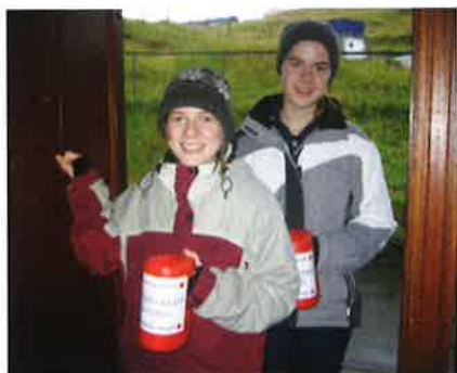
Innsavning fyrir Reyða Kross.

Hvat fæst fyrir peningin í menningarlandum? Um tú hvønn mánað í eitt ár letur