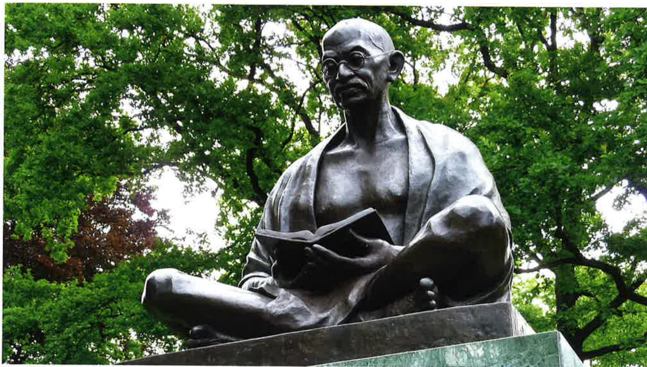
Standmynd av Mahatma Gandhi.