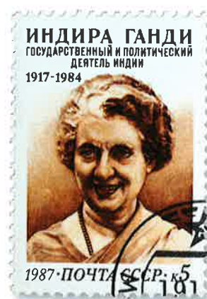
Russiskt frímerki við mynd av Indiru Gandhi.

Indira Gandhi, sum í 1966 varð vald til forsætisráhanna í India, varð myrd í 1984 av einum lívverja. Sonur hennara Rajiv Gandhi tók við eftir móður sína, men varð myrður í einum valstriði í 1991. Heilt so friðarligt, sum Mahatma Gandhi ætlaði, gjørdist fyrsta tíðarskeiðið hjá einum frælsum India ikki.