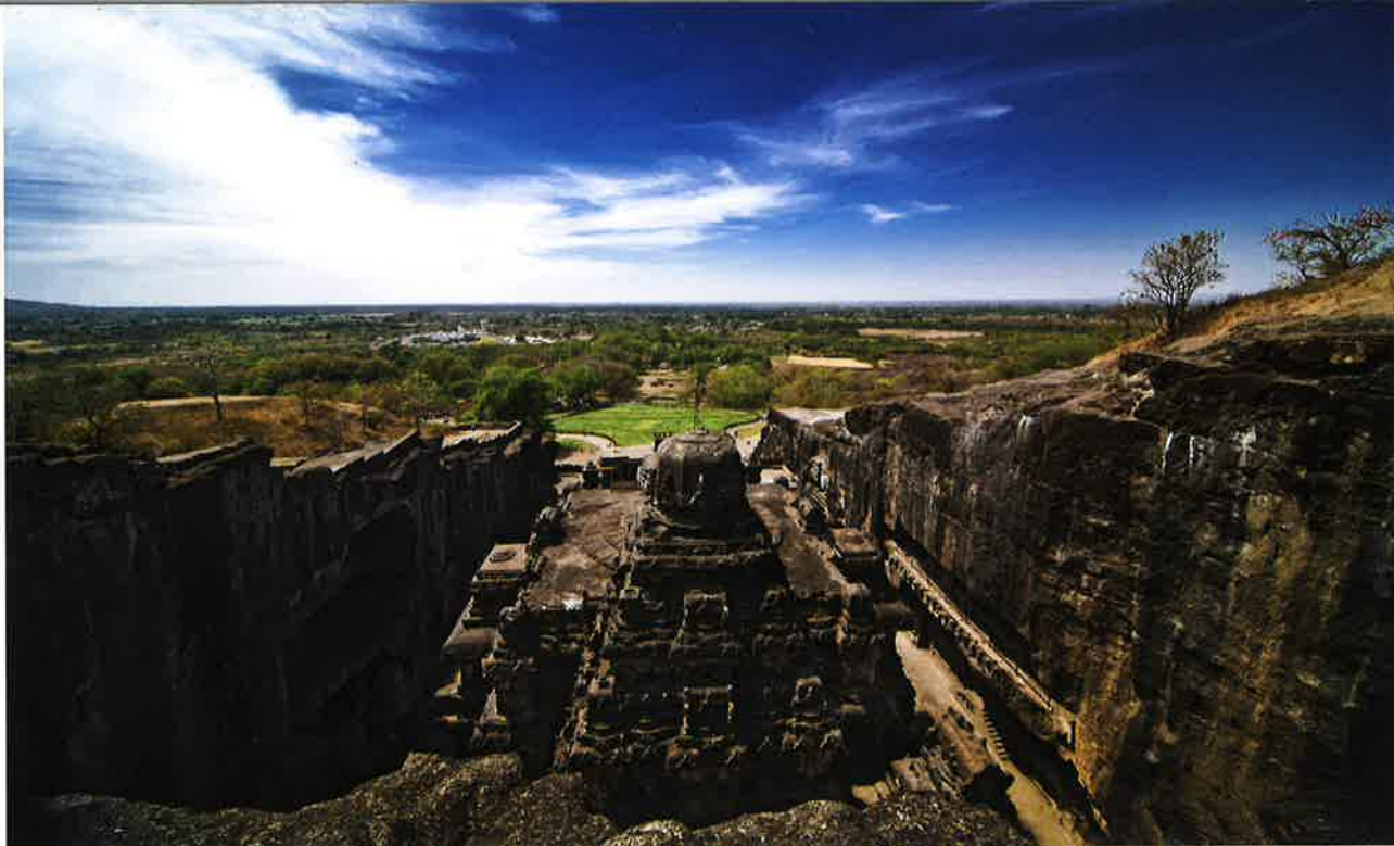
Elloratempluholurnar í India eru 34 í tali. Hetta er tann 16. tempulholan, Kailasa.