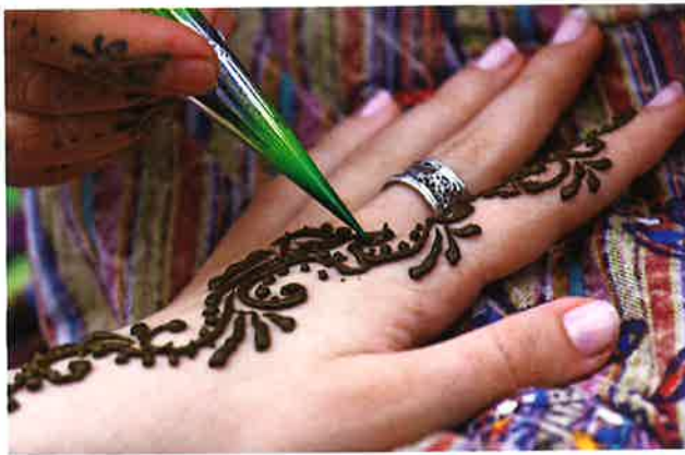
Brúður verður gjörd klár.