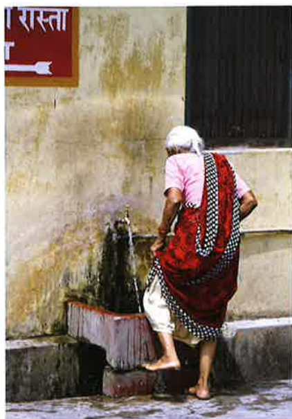
Ein gomul indisk kona vaskar sær um føturnar.

Halgidómur hjá hinduum er templið. Tey eru í túsundatali um alt India. Ofta verða templini bygd, har okkurt týðningarmikið og guddómligt er hent. Vatn má vera á staðnum, tí at reinsan hevur nógv at siga í hinduismuni.