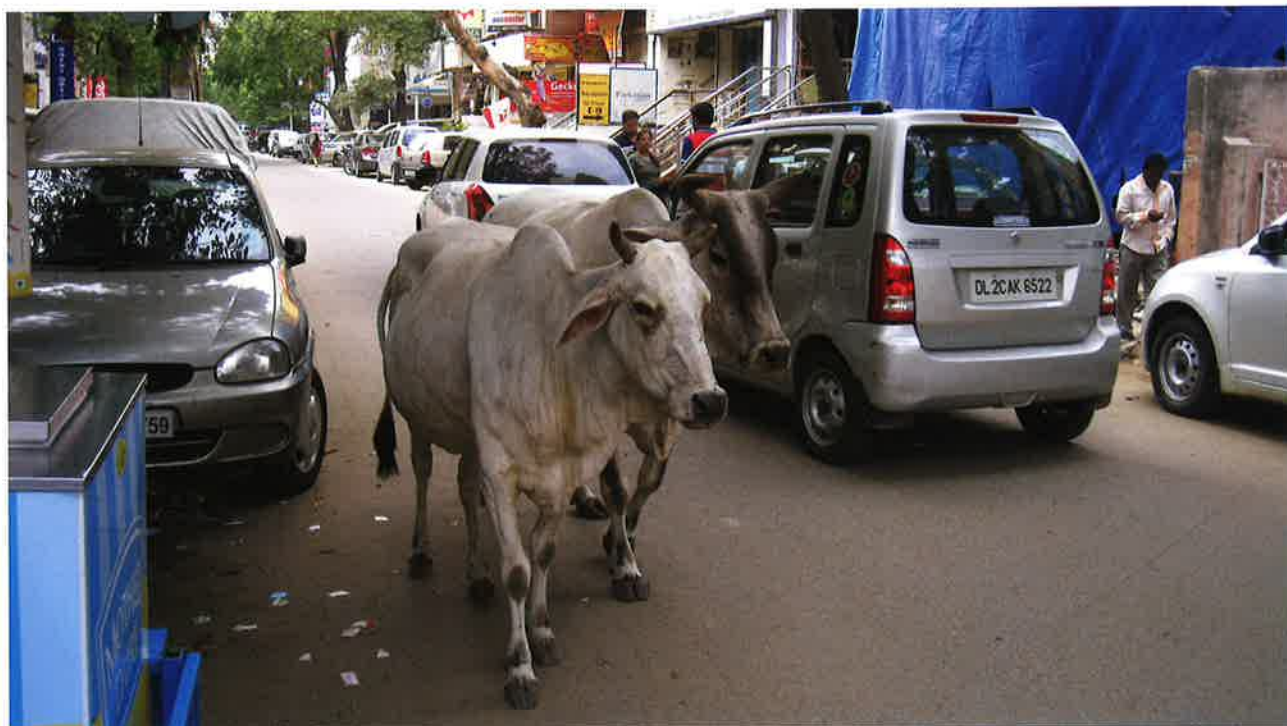
Í Indía gongur kúgvín sum hon vil allastaðni.