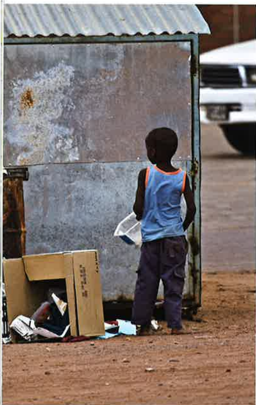
Afrikanskt barn leitar eftir mati í ruskdunganum.

Tað eru annars nógvir aðrir felagsskapir, umframt einstaklingar, ið gera eitt megnar arbeiði at bota um hjá teimum, ið hava hjálpað fyri neyðini. Her á landi hava vit fleiri, ið eru farin út í onnur lond at rætta eina hjálpanði hond. Onnur savna støðugt inn pening, klæði, og brúkslutir, ið tey føra til støð, har alt verður móttikið við takksemi og gevur teimum, ið har bógva, eina betri framtíð.