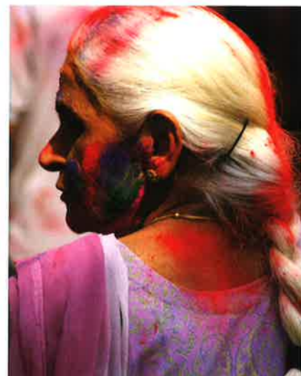
Gomul kona hátíðarheldur holi.

Holi, várveitslan, verður hildin í februar ella mars mánaði. Hon verður altíð hildin, tá fullmáni er, og er til minnis um, at nú má myrkrið víkja fyri ljósinum. Hon kann vara frá einum degi til fyra dagar, fólk eru í góðum lag og leggja allan kastumun til viks hesar dagar. Høgtíðin hevur eisini samband við mýtuna um demonkvinnuna Holika, sum ætlaði at brenna skyldmannin Prahlad á báli, av tí at hann hevði tilbiðið gudin Vishnu. Vishnu bjargaði Prahlad, og Holika var brend á bálinum í staðin. Hesa høgtíð brenna hinduar eina dukku á báli, sum skal minna um Holika. Eisini kasta tey litríkt pulvur á hvønn annan, og fólk spæla hvørjum øðrum okkurt puss.