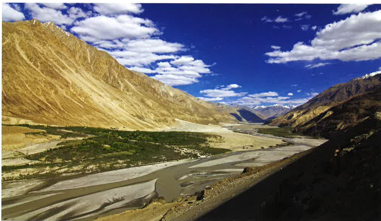
Ein lítil bygd í landspartinum Ladakh, við ána Indus í Indusdalinum.