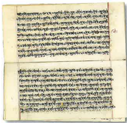
Rigvedahandrit frá 19. öld.