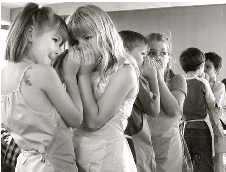
Mynd frá alnótini

Jo flere dærlige hemmeligheder, der er i en familie, jo sværere er det at være i den.