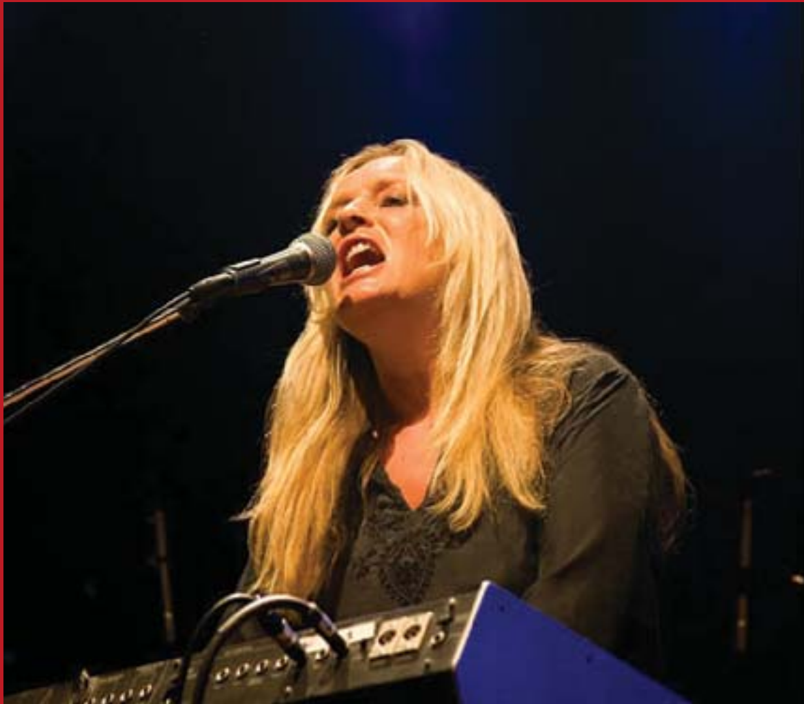
Mynd fra alnótini