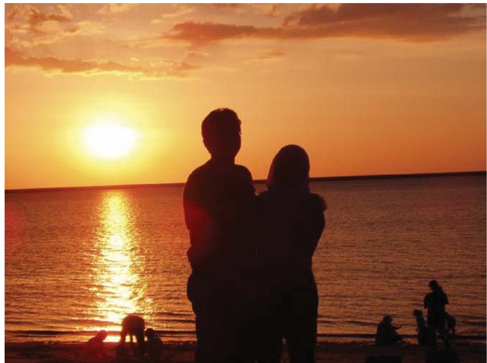
Mynd fra alnótini