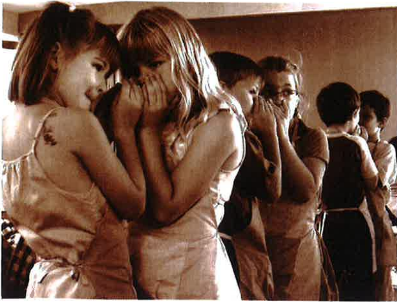
Mynd fra alnótini

Jo flere dærlige hemmeligheder, der er i en familie, jo sværrere er det at være i den.