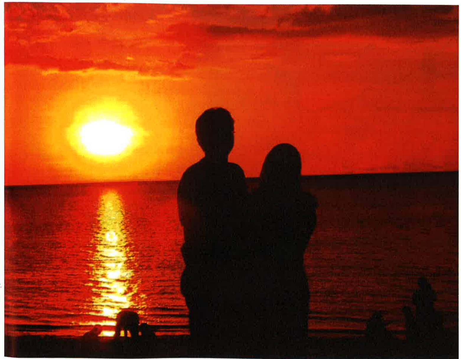
Mynd fra alnótin