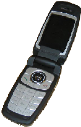
Fartelefon 3099 kr