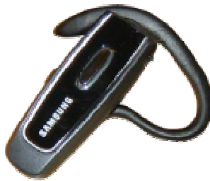
Bluetooth Headset Wep 150 825 kr