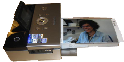
Prentari 1179 kr

Drós keypti sær eina fartelefon og ymiskt annað, ið hoyrir eini fartelefon til. Hon keypti fartelefon, Bluetooth Headset Wep 150 og ein tráðleysan prentara til fartelefonina.