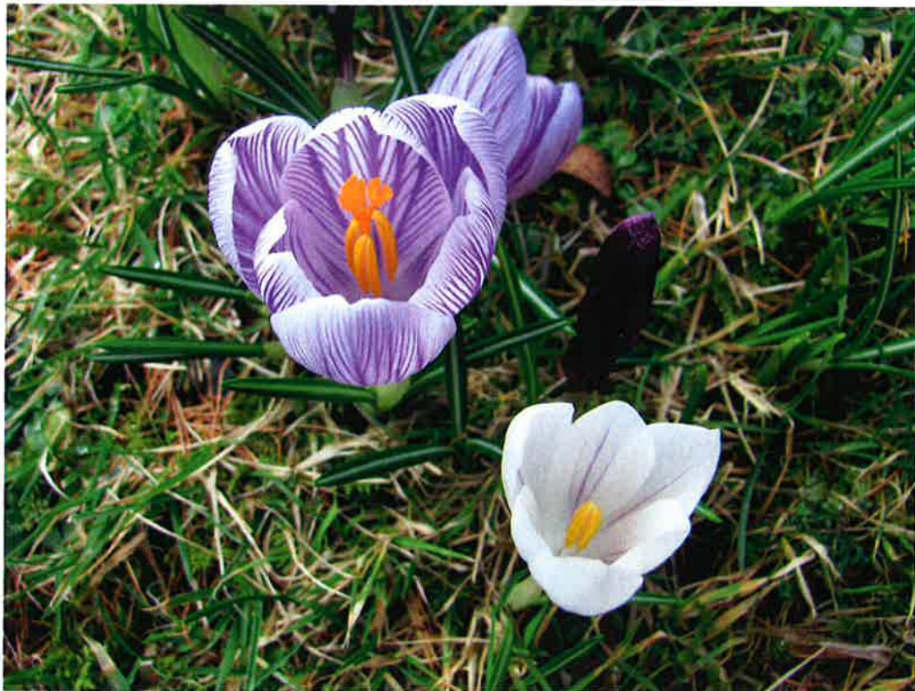
Mynd: Gulakur Zachariasen