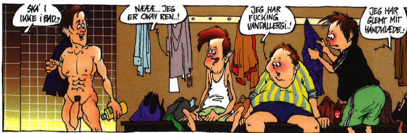
UNGE DROPPER BADET EFTER IDRÆT..!