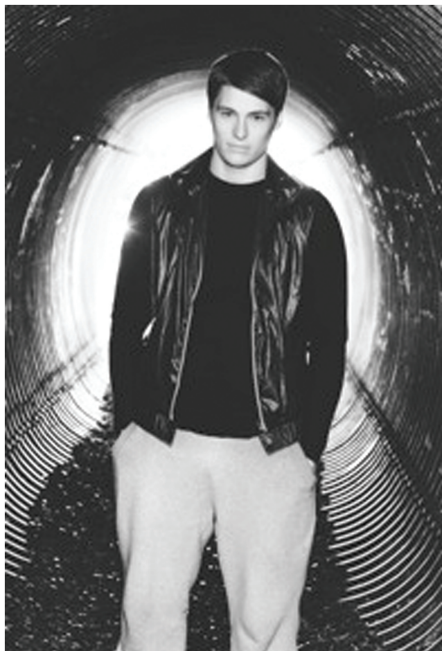
Mynd av heimasíðuni hjá www.rff.fo